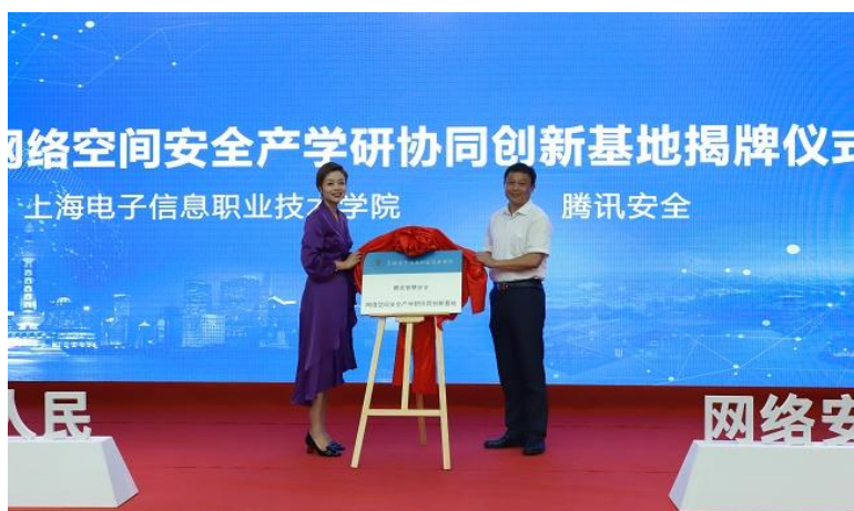
图 1：腾讯网络空间安全产学研协同创新基地